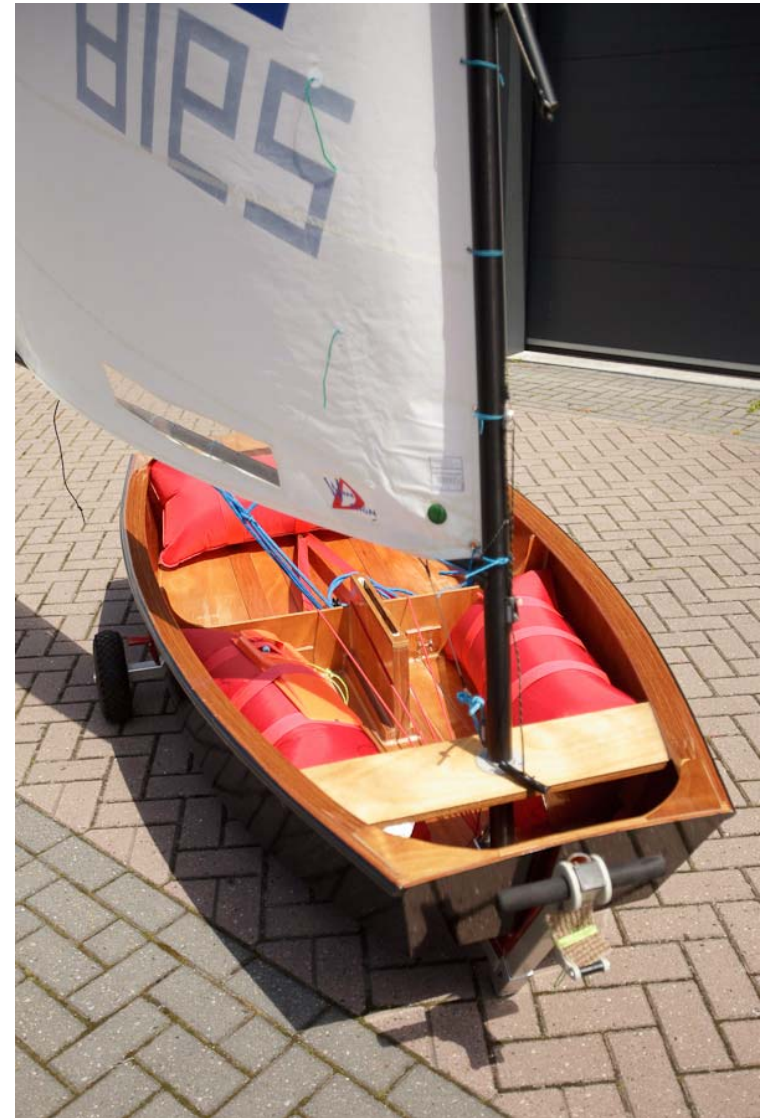
Optimist NED 2918 / 2