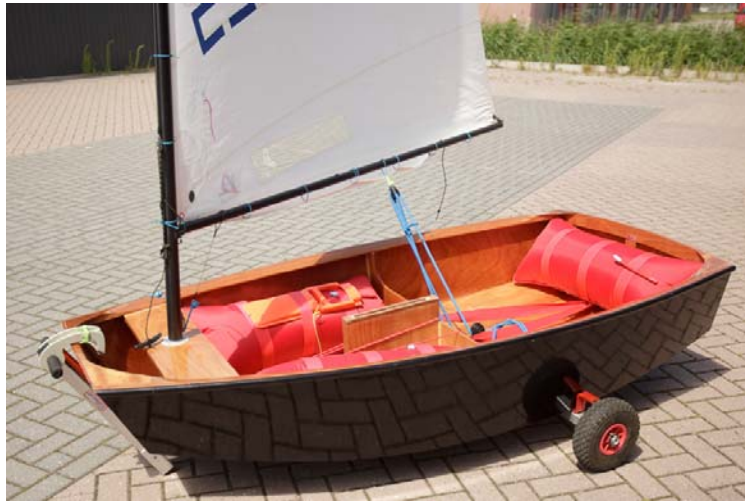
Optimist NED 2918 / 3