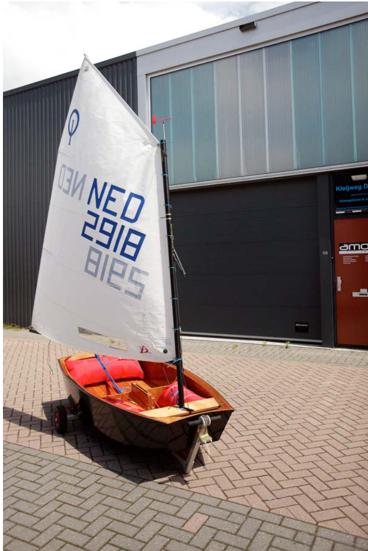
Optimist NED 2918 / 1