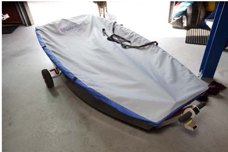
Optimist NED 2918 / 4