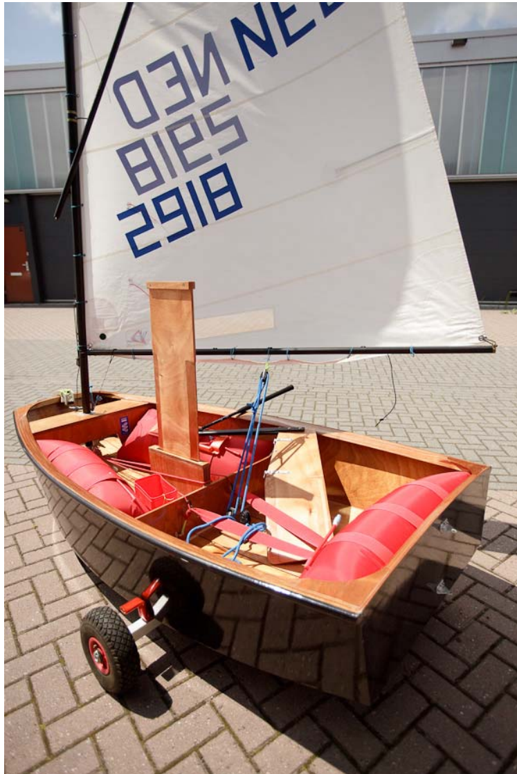
Optimist NED 2918 / 6